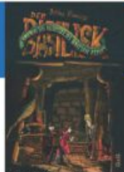
Bettina Kleinszig Der Basilisk - Die sagenhaften Abenteuer des Bastian Zekoff GGG