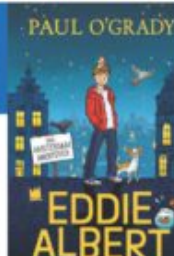
Paul O'Grady Eddie Albert und die Tierbande - Das Amsterdam-Abenteuer von Hecht