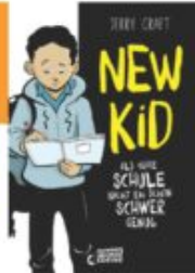
Jerry Craft New Kid - Als wäre Schule nicht eh schon schwer genug Loewe Graphix