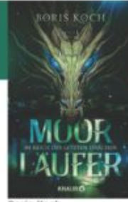
Boris Koch Moorläufer - Im Reich des letzten Drachen Krauz