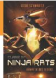
Gesa Schwartz Clans of Ninja Rats - Kämpfer des Feuers cbj