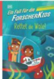
S. J. King Ein Fall für die Forscher-Kids - Rettet die Wale! Dorling Kindersley