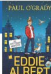
Paul O'Grady Eddie Albert und die Tierbande - Das Amsterdam-Abenteuer von Hecht