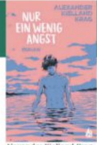
Alexander Kielland Krag Nur ein wenig Angst Arctis