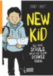
Jerry Craft New Kid - Als wäre Schule nicht eh schon schwer genug Loewe Graphik