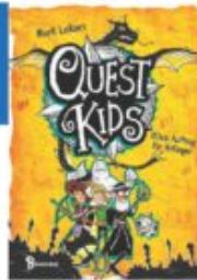
Mark Leiknes Quest Kids - (Kein Auftrag für Anfänger Baumhaus