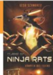
Gesa Schwartz Clans of Ninja Rats - Kämpfer des Feuers cbj