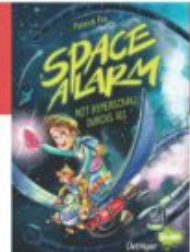
Patrick Fix Space Alarm - Mit Hyperschall durchs All Delfinger Splash