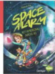
Patrick Fix Space Alarm - Mit Hyperschall durchs All Delfinger Splash