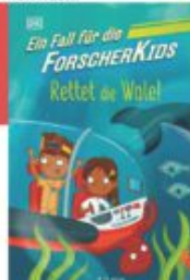
S. J. King Ein Fall für die Forscherkids - Rettet die Wale! Dorling Kindersley