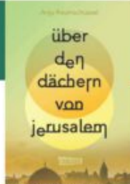
Arja Reumshüssel Über den Dächern von Jerusalem Carlsen