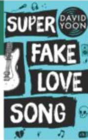
David Yoon Super Fake Love Song cbj