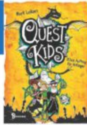
Mark Leiknes Quest Kids - (Kein Auftrag für Anfänger Baumhaus