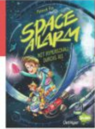
Patrick Fix Space Alarm - Mit Hyperschall durchs All Delfinger Splash