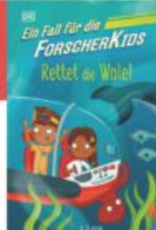
S. J. King Ein Fall für die Forscherkids - Rettet die Wale! Dorling Kindersley