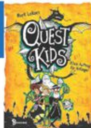
Mark Leiknes Quest Kids - (Kein Auftrag für Anfänger Baumhaus