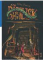
Bettina Kleinszig Der Basilisk - Die sagenhaften Abenteuer des Bastian Zekoff GGG