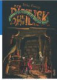
Bettina Kleinszig Der Basilisk - Die sagenhaften Abenteuer des Bastian Zekoff GGG