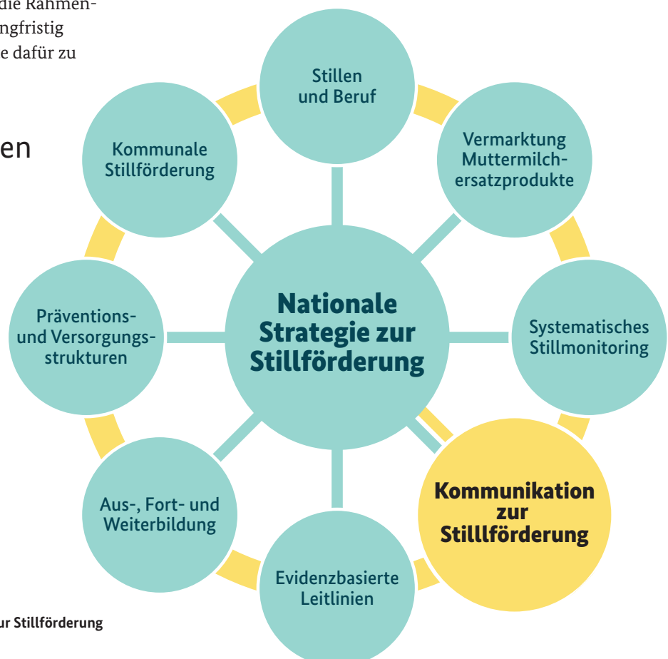
Abbildung 4: Strategiefelder der Nationalen Strategie zur Stillförderung