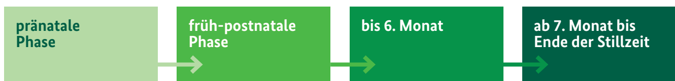
Abbildung 1: Phasen des Stillens (modifiziert nach Australian National Breastfeeding Strategy 2010–2015 )

Das ausschließliche Stillen (siehe Infobox auf der nächsten Seite) ist in den ersten sechs Monaten die von der Weltgesundheitsorganisation (WHO) empfohlene Form der Ernährung für Säuglinge. Die derzeitige Handlungsempfehlung in Deutschland sieht vor, in den ersten sechs Monaten ausschließlich zu stillen, mindestens jedoch vier Monate. Auch nach Einführung der Beikost sollte weiter gestillt werden. Wie lange insgesamt gestillt wird, entscheiden Mutter und Kind. Jegliches Stillen ist wertvoll.