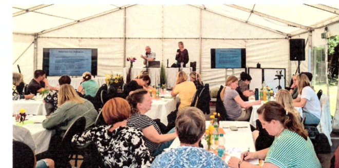
Entspanntes Miteinander @Sommerschule 2023